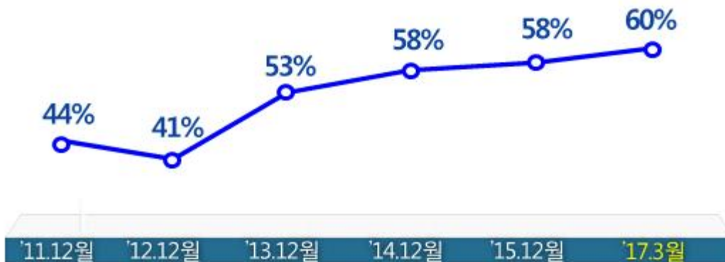
< 2G·3G·LTE 중 LTE 비중 >